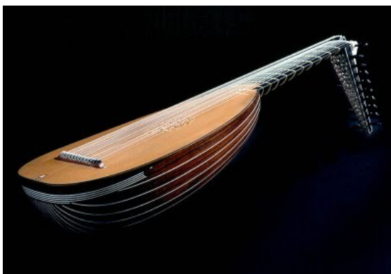
Pelbagai bentuk gambus