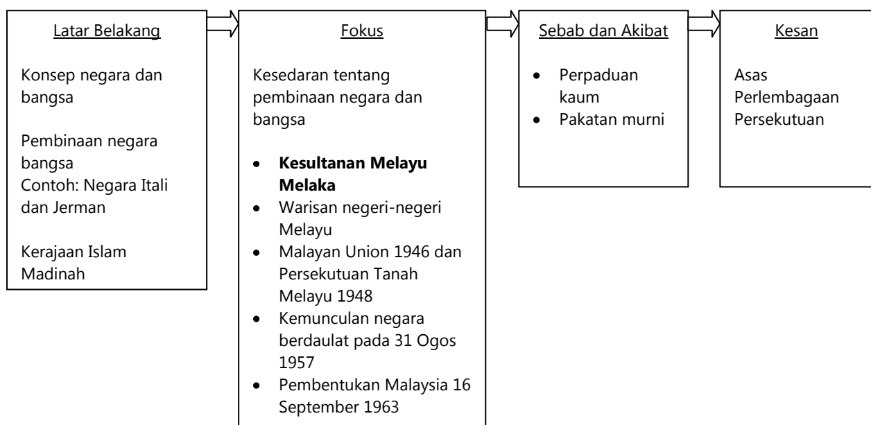
Carta Aliran Kesedaran Pembinaan Negara Bangsa Huraian Sukatan Pelajaran Sejarah Tingkatan 5

Carta aliran bagi tema ini boleh memberi lebih kefahaman tentang kedudukan sejarah Kesultanan Melaka sebagai sebahagian unsur yang memberi impak terhadap pembangunan negara bangsa.